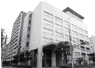
【夕陽丘高等職業技術専門学校】