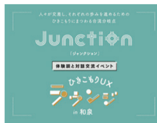
ひきこもりUXラウンジのロゴ