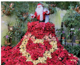
ポインセチアのフラワードレス

クリスマスに合わせ、温室にポインセチアのフラワードレスが登場。まるでドレスを着ているかのような写真が楽しめます。12/14(土)～22(日)の土・日曜には園内にサンタクロースが現れます。クリスマスマーケットも開催予定です。