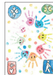
ポスター-小学生部門 最優秀作品