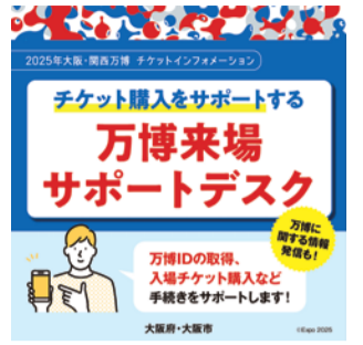
万博来場サポートデスク

大阪府および大阪市では、より多くの人に2025年大阪・関西万博にご来場いただくため、「万博来場サポートデスク」を設置しています。サポートデスクでは、Webサイトを通じたチケット購入や万博IDの取得方法、来場日時予約、パビリオン入場予約などの手続きに関するサポートを行っています。そのほか、万博の最新情報の発信もしています。イオンモール・キューズモールなどの商業施設や大阪市区役所、イベントブースなどの各所を巡回しており、今後も府内各所で展開予定です。チケットや引換券は、Webサイトだけではなく、全国三大コンビニエンスストアや旅行会社でもご購入いただけます。チケットの購入方法などでお困りのことがあれば、ぜひ「万博来場サポートデスク」をご活用ください!