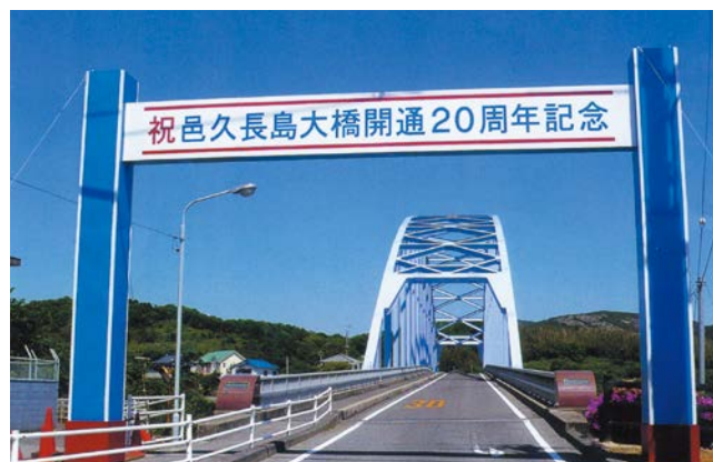
人間回復の橋と呼ばれる邑久長島大橋

長島と対岸の虫明を結ぶ邑久長島大橋は、1988年(昭和63年)に開通しました。隔離する必要のない証、人間回復の証として架橋され、現在は民間バスも乗り入れ、入所者も自由に島外に出かけられるようになっています。