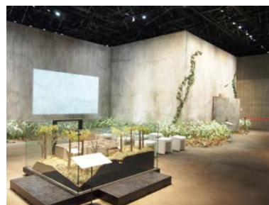
縮尺1/20の模型(手前)と実寸大で部分再現された重監房

〒377-1711 群馬県吾妻郡草津町草津白根464-1533 電話 0279-88-1550 URL https://www.nhdm.jp/sjpm/