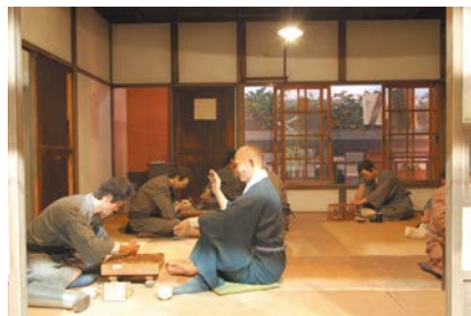
昔の療養所の暮らしが再現されています

〒189-0002 東京都東村山市青葉町4-1-13 電話 042-396-2909 URL https://www.nhdm.jp/