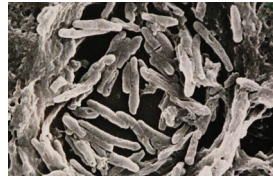
らい菌 電子顕微鏡写真

「らい菌」はもともと感染する力が弱く、たとえ感染したとしても、発病する力はとても弱い細菌です。現在の日本の衛生状態や、生活や医療の環境を考えると、感染することや発病することはほとんどありません。