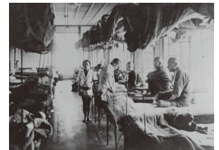
病棟看護