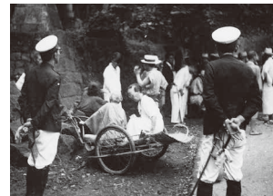
本妙寺部落の強制収容

つまり、治る病気であり、隔離の必要もなかったハンセン病患者の強制収容は続けられ、療養所に収容されると、多くの人は一生そこから出ることができなかったのです。