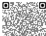
噴火速報について