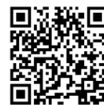
プッシュ型通知サービスについて