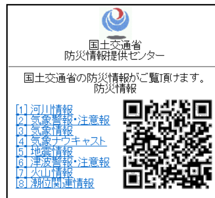
防災情報提供センター 携帯端末向けホームページ (Top)