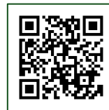
地産地消の取組ページ