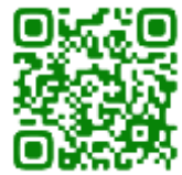
参加申込フォーム

日時：令和6年7月10日（水）14時～15時ごろまで 方法：zoom ミーティングを予定 内容：説明15分程度の後、お問合せなどにお答えいたします。 参加定員：30名程度