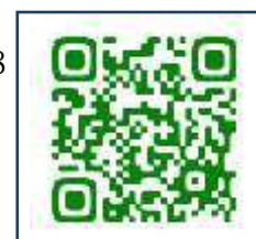
申込フォーム QR コード

○参加申込フォーム(Googleフォーム) https://forms.gle/zcfeFTw8B1Du4CwR8