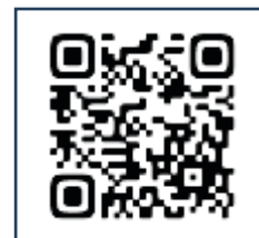
応募フォーム QR コード

○応募フォーム(Googleフォーム) https://forms.gle/kCrEsxNEqKJhUfAL9