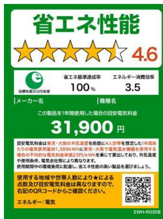
(電気温水機器のイメージ)

※温水機器以外は、製品のサイズやネット取引等の限られたスペースで使用する場合は右側のミニラベルを活用すること。