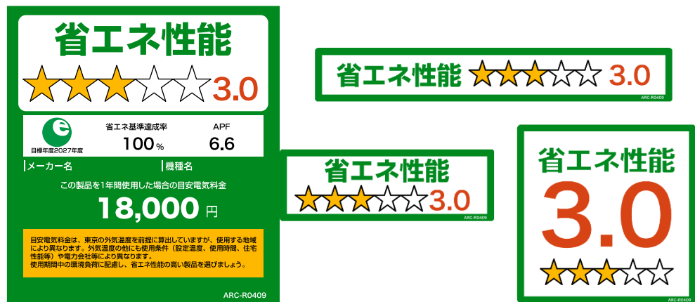
(家庭用エアコンディショナーのイメージ)