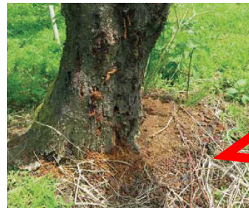
クビアカツヤカミキリのフラス