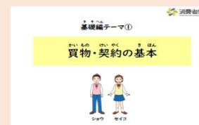
特別支援学校向け 消費者教育用教材