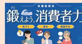
「鍛えよう、消費者力」