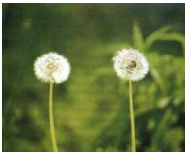
「病者が病者でいられる社会」1990年5月 万博日本庭園