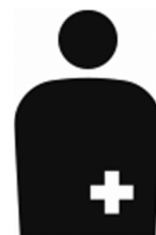
【オストメイト用設備/オストメイト】 所管：公益財団法人 交通エコロジー・モビリティ財団