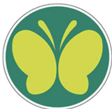
【聴覚障害者標識 (聴覚障害者マーク)】 所管：警察庁