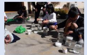
小学生によるアマモ場の創出