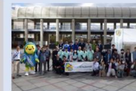
豊かな海づくり啓発イベントの開催