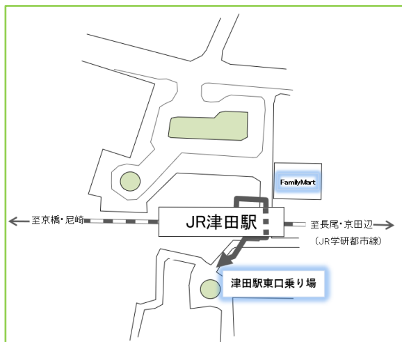
京阪バス津田駅東口乗り場