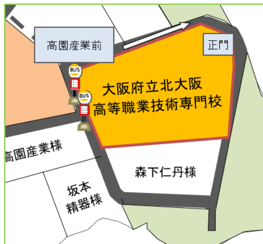
本校及び高園産業前バス停