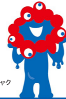
大阪・関西万博公式キャラクター ミyakumiyako

2025年の4月13日 から10月13日まで開 催される、大阪・関西万博までいよいよ2年 を切りました。会場では、ミyakumiyakoフォト パネルでの記念撮影や、VRゴーグルで仮 想空間・バーチャル大阪を体験できます!