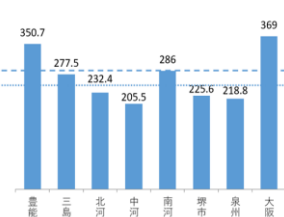
◆二次医療圏別の医師偏在指標