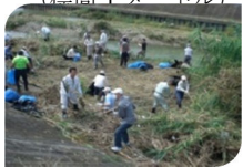
クリーンキャンペーン