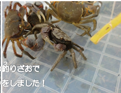
お手製の釣りざおで カニ釣りをしました！