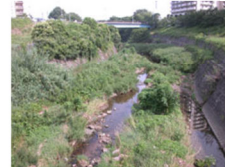
清見橋上流 (標高25メートル)