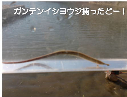
ガンテンイシヨウジ捕ったどー！