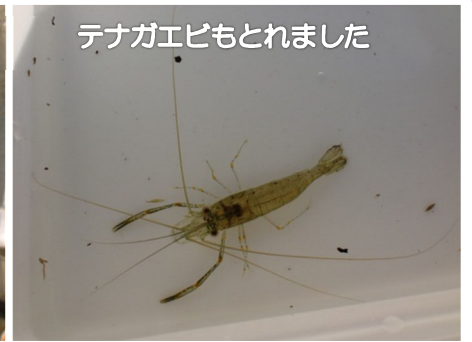
テナガエビもとれました