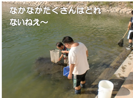
なかなかたくさんはとれないねえ～

まず、先生方に「汽水ワンド」のことを知っていただくために、10月3日（水）にワンドで生物 調査などを行いました。「ガンテンイシヨウジ」という珍しい魚も見つけることができました。