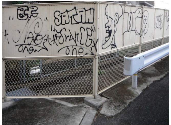
現状（歩道橋下のフェンス）