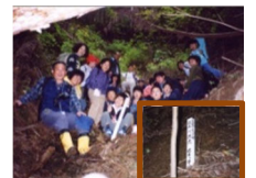
子ども達による源流調査