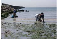
河口部での海岸生物調査 ハクセンシオマネキなど (1995～)