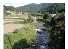
蕎原大橋上流 (標高195メートル)