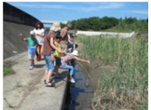
子ども達によるカニ釣り