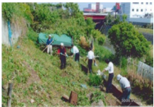
アドブトリバー プログラム