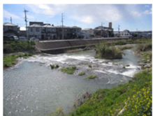
脇浜 (堰堤付近) (標高1メートル)