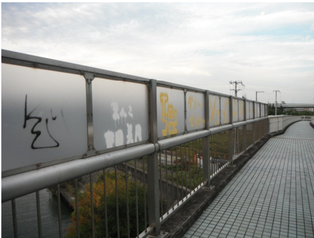
現状（歩道橋の高欄）

次号の「近木川通信」では、絵画や写真などの募集方法を掲載したいと考えていますので、是非、奮ってご応募ください。