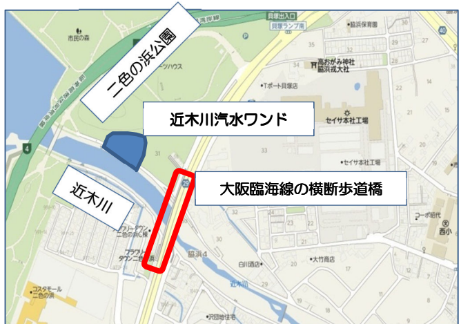
ワンドとの位置関係