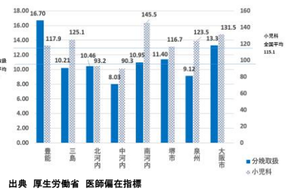
◆二次医療圏別の医師偏在指標(産科・小児科)