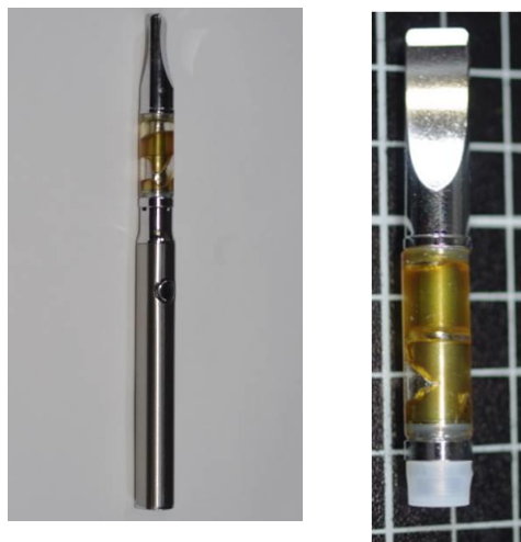
大麻リキッド (電子タバコ型)