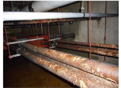
電気幹線配管 電線管腐食 (漏電による全館停電の危険性)

※7 「DB (Design-Build) 方式」…設計 (基本設計・実施設計の両方もしくは実施設計のみ) と、建築工事を同一の事業者が一括で行う整備手法のこと。