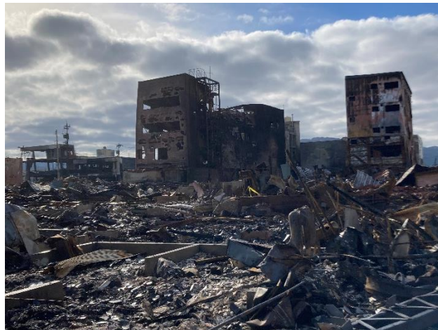
能登半島地震・輪島市朝市の被災状況(2024年1月1日)