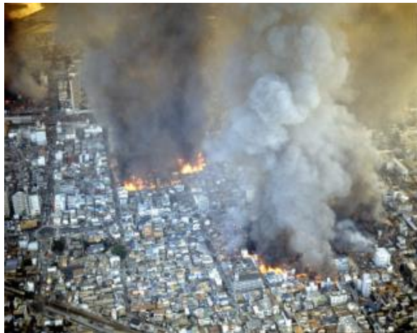
阪神・淡路大震災時の被災状況(1995年1月17日)