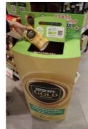
写真(左):イオンスタイル神戸南の売り場 / 写真(中央・右):「ネスカフェ エコ&システムパック」回収ボックス