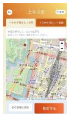
「地点を設定して体験」モード