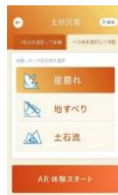
「災害を選択して体験」モード