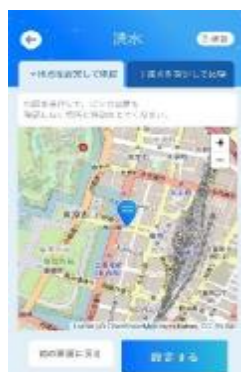
「地点を設定して体験」モード

ユーザ自身が水深を設定し、リスクを疑似的に可視化します。浸水の深さは30cm・50cm・1m・2m・3mで設定可能です。