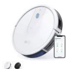
Eufy RoboVac 15C カラー：ホワイト、ブラック

https://www.anker-japan.com/pages/robovac-support