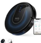
Eufy RoboVac G30 カラー：ホワイト、ブラック