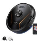
Eufy RoboVac X8 Hybrid カラー：ブラック、ホワイト