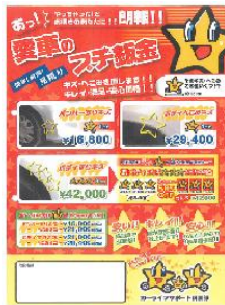
消費者向けPRツール