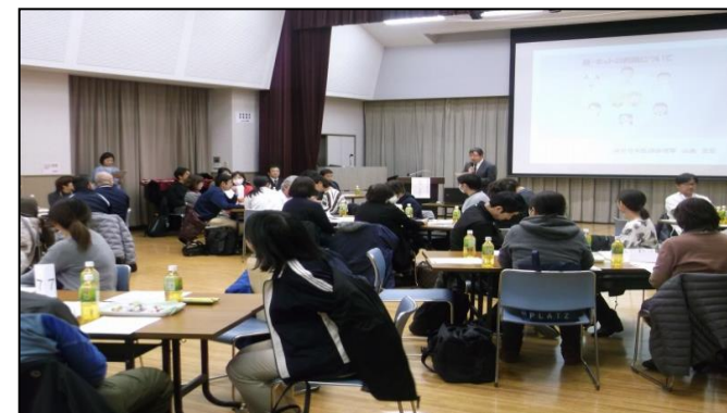
↑いかしてネットかしわら研修会

★医療と看護の連携シートを作成し、柏原市内の訪問看護ステーションとの連携に活用しています。