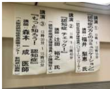
推進員2名と 認知症疾患医療セン ター長による講話

年に一度、高槻市役所にて市民を対象に「認知症啓発イベント」を行なっている。毎年右肩上がりに参加者は増えており、今後も個々のニーズを拾いながら、市民に対して啓発を行なえる場にしていきたい。