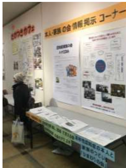
本人・家族会や医療機関 など市内で利用できる 資源の情報発信