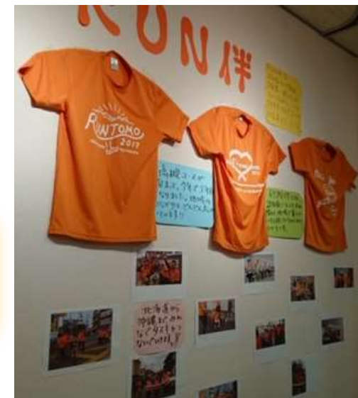
「RUN伴」など認知症関連 の情報も発信