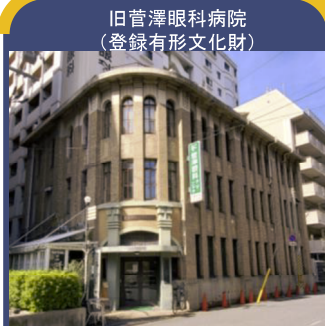
旧菅澤眼科病院 (登録有形文化財)

所在地: 大阪市西区江戸堀1-23-17 建築年: 1922年(大正11年) 設計: ヴォーリス建築事務所 様式: ロマネスク様式 構造: 鉄骨煉瓦造、3階建て