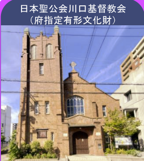
日本聖公会川口基督教会 (府指定有形文化財)

所在地: 大阪市西区江戸堀1-10-26 建築年: 1935年(昭和10年) 設計: 岡本工務店 様式: スパニッシュ様式 構造: RC造、3階建て地下1階