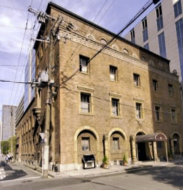
大阪倶楽部 (登録有形文化財)

所在地: 大阪市中央区今橋4-4-11 建築年: 1924年(大正13年) 設計: 片岡建築事務所(安井武雄) 構造: RC造、4階建て地下1階