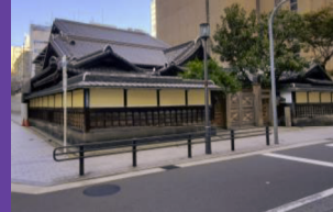
愛珠幼稚園園舎 (重要文化財)

所在地: 大阪市中央区今橋3-1-11 建築年: 1901年(明治34年) 設計: 伏見柳、久留正道、中村竹松 構造: 木造、平屋一部2階建て 【現存最古かつ現役の幼稚園園舎】