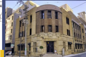
芝川ビル(旧芝蘭社家政学園) (登録有形文化財)

所在地: 大阪市中央区伏見町3-3-3 建築年: 1927年(昭和2年) 設計: 澁谷五郎、本間乙彦 様式: 古代中南米様式 構造: RC造、4階建て地下1階