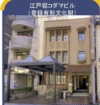
江戸堀コダマビル (登録有形文化財)

所在地: 大阪市西区江戸堀1-10-26 建築年: 1935年(昭和10年) 設計: 岡本工務店 様式: スパニッシュ様式 構造: RC造、3階建て地下1階