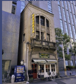
今橋ビルディング (旧中央消防署今橋出張所) (登録有形文化財)

所在地: 大阪市中央区今橋4-5-19 建築年: 1925年(大正14年) 様式: 元消防署出張所 構造: RC造、4階建て