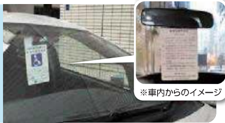
※車内からのイメージ

利用証は駐車する時、ルームミラーにかけるなど、外から見えるように掲示してください。