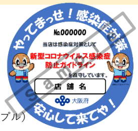
感染防止宣言ステッカー（サンプル）