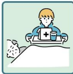
がん・難病・精神疾患など慢性的な病気の家族の看病をしている