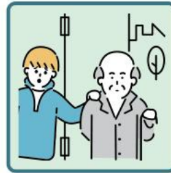
目を離せない家族の見守りや声かけなどの気づきをしている