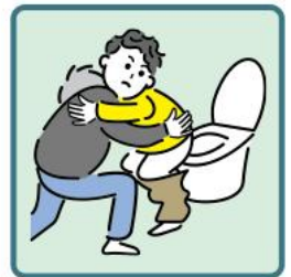
障がいや病気のある家族の入浴やトイレの介助をしている