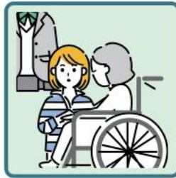
障がいや病気のあるきょうだいの世話や見守りをしている