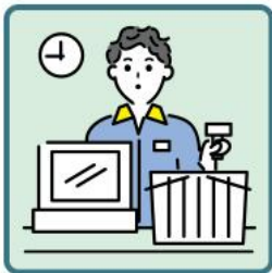
家計を支えるために労働をして、障がいや病気のある家族を助けている