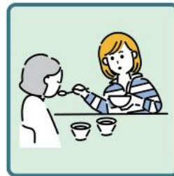
障がいや病気のある家族の身の回りの世話をしている