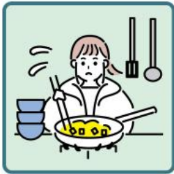
障がいや病気のある家族に代わり、買い物・料理・掃除・洗濯などの家事をしている

※「多機関・多職種連携によるヤングケアラー支援マニュアル～ケアを担う子どもを地域で支えるために～」(R4.3)より