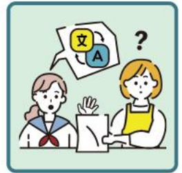
日本語が第一言語でない家族や障がいのある家族のために通訳をしている