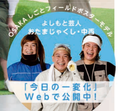
OSAKAしごとフィールド スタッフ