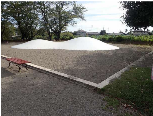
事故発生遊具（通常時）