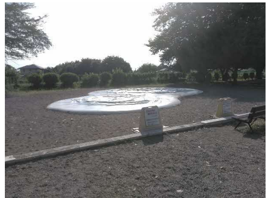
事故発生遊具（空気が抜けた状態）