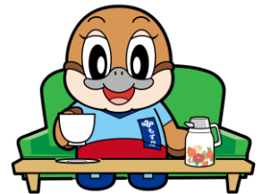
不要不急の外出自粛