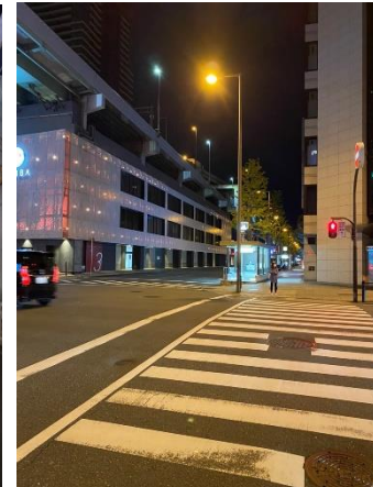
【中央区】堺筋本町周辺