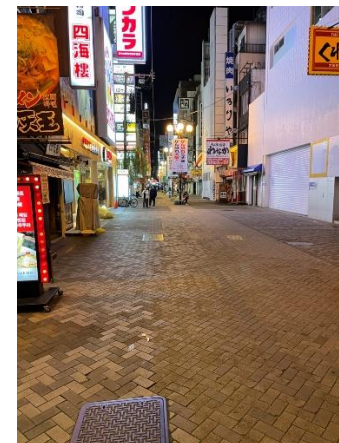
【中央区】道頓堀周辺