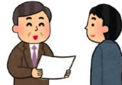
【総括製造販売責任者の選任】