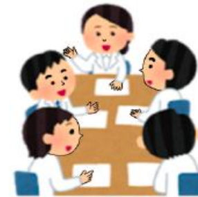
【総括製造販売責任者の意見の尊重】