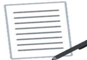
【総括製造販売責任者の権限の明確化】