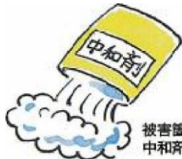
被害箇所中和剤等を散布する。