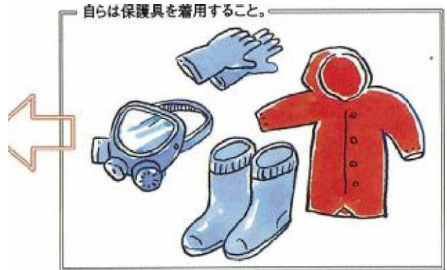
自らは保護具を着用すること。