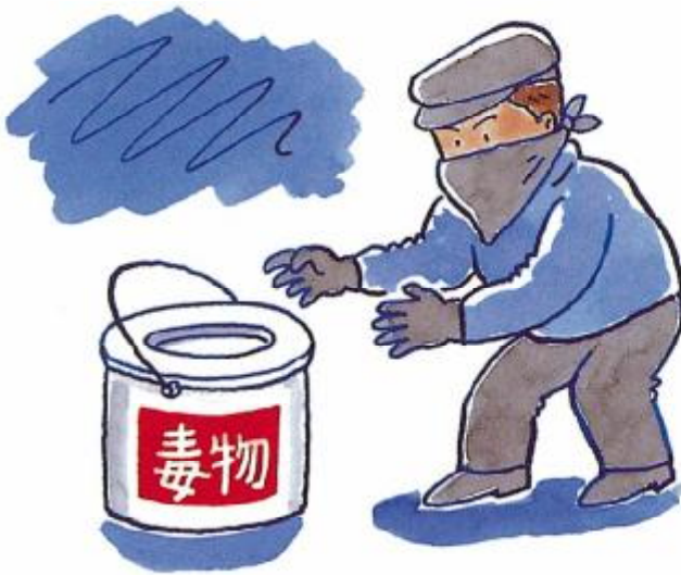
盗難にあいやすい

毒劇物の管理は盗難や危害防止のためのきめ細かい対策が必要です。不必要な毒劇物を購入することによって、思わぬ災難がふりかかる可能性もあります。慎重に購入して下さい。