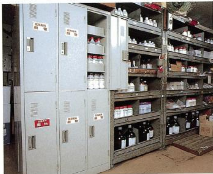
陳列する棚にも毒劇物の表示をし、明確に区別する。