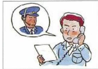
直ちに警察に通報する。