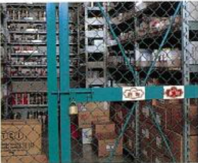
頑丈な保管庫に厳重な施錠

厳重な保管管理を行うため、堅牢な保管庫のロックシステムを使用するようにします。また、セキュリティシステムを導入するなど人の出入りには厳重なチェックを行います。