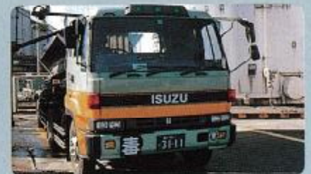
毒劇物であることをはっきりと表示する。