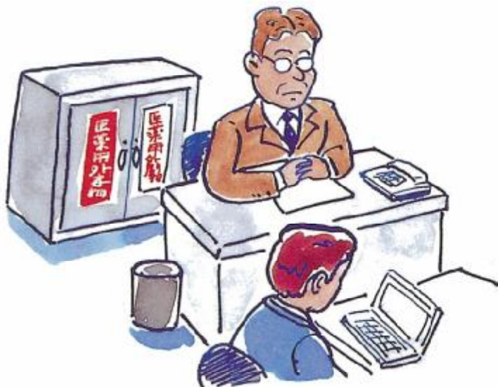
毒劇物の有無が確認できる場所に置く。

毒劇物がどこにどのくらいあるか、管理者は常に把握しておく必要があります。目配りが利く場所に置いて管理することは、盗難を未然に防ぎます。また、地震や火事といった災害時にも素早い対応ができるので、自分や周囲の人々を毒劇物の危害から守ることになります。