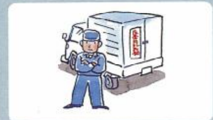
不審者が車に近づかないよう注意する。