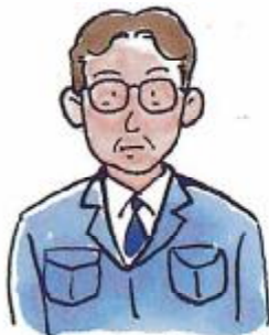
鍵の管理者を明確にする