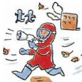
風下の人に知らせ退避させる。