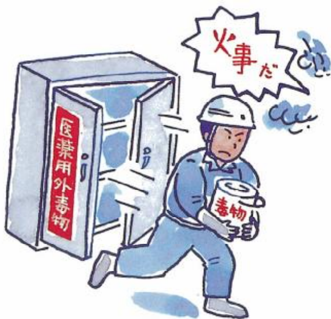
迅速に搬出、避難できる。