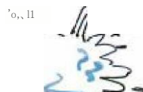
河川などに流出しないように注意する。

一般の人が発見した場合は、警察署又は消防署、保健所などに速やかに連絡し、関係各機関の指示に従いましょう