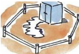
周辺にロープを張るなどして人の立入りを禁止する。

当事者には被害を最小限にとどめる責任があります。放置すれば、毒劇物によって他人に危害を与える恐れがありますので、速やかに被害を食い止める措置を講じて下さい。