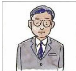
通報担当者を決めておく

いざという時にあわてないように、予めだれが通報するのか決めておきます。通報担当者がいない場合にはどうするかも決めておきます。