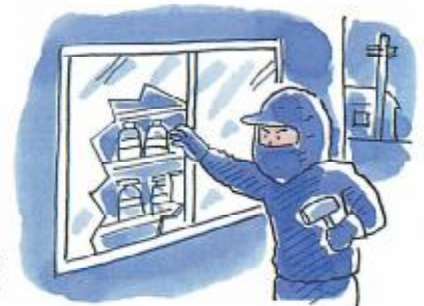
建物の窓のそばは盗難にしやすい。