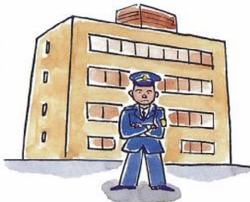
建物全体にセキュリティシステムを導入する方法