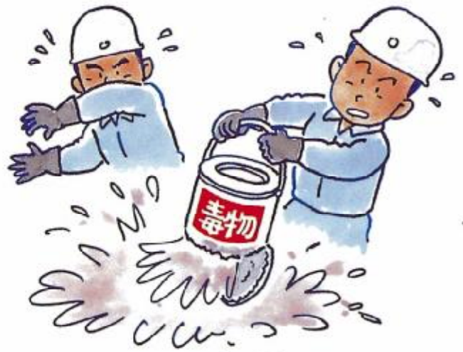
事故を起こしやすい