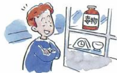
興味を引いてしまう。