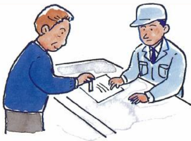
買い手が必要事項を記入し、捺印した譲受文書を提出。

毒物劇物営業者は、譲受人から前項各号に掲げる事項を記載し、印を押した書面の提出を受けなければ、毒物又は劇物を毒物劇物営業者以外の者に販売し、又は授与してはならない。