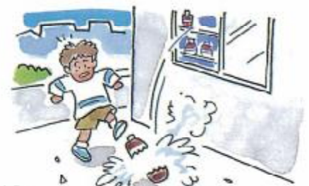
落ちてきて、被害にあう。