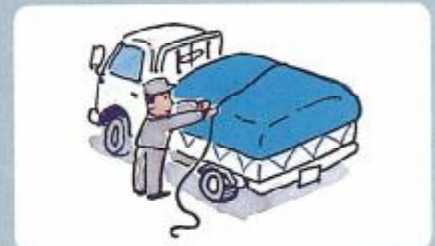
シートでおおい、ロープをしめる。

運搬時は、毒劇物の管理者であるという意識をしっかりと持ち、一般の人々の手に渡ることがないように、注意深く作業をする必要があります。