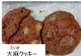
たいま 大麻クッキー

うえ しゃしん たいま 上の写真はすべて大麻です。 たいま くさ そだ たいま きんし 大麻の草を育てることや、大麻をもつことは禁止されています。 たいま はい 大麻は、クッキーやチョコレートなどに入っていることがあります。 たいま はい ぜったい 大麻の入ったものは絶対にもらわないでください。