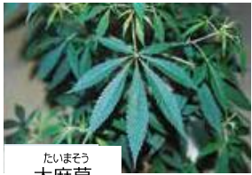
たいまそう 大麻草