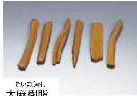
たいまじゆし 大麻樹脂