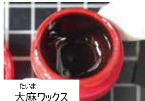
たいま 大麻ワックス