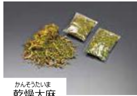
かんそうたいま 乾燥大麻