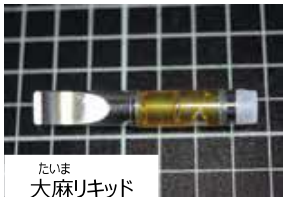
たいま 大麻リキッド