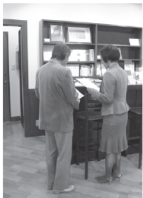
「太宰治文学サロン」を訪れ、説明を聞く来館者

「走れメロス」「人間失格」などの作品を残した作家・太宰治(1909～48)が、昨日19日で生誕100年を迎えた。各地で様々な催しが行われる中、太宰ゆかりの地、東京都三鷹市には、全国から多くのファンが訪れ、何年たっても色あせることのない太宰の魅力が改めて浮き彫りにした形となった。【関連記事20面】