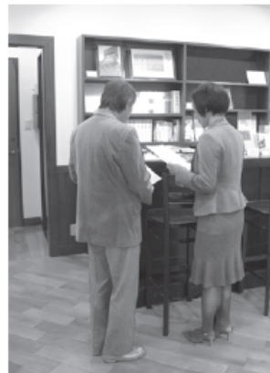
「太宰治文学サロン」を訪れ、説明を聞く来館者

「走れメロス」「人間失格」などの作品を残した作家・太宰治(1909～48)が、昨日19日で生誕100年を迎えた。各地で様々な催しが行われる中、太宰ゆかりの地、東京都三鷹市には、全国から多くのファンが訪れ、何年たっても色あせることのない太宰の魅力が改めて浮き彫りにした形となった。 【関連記事20面】