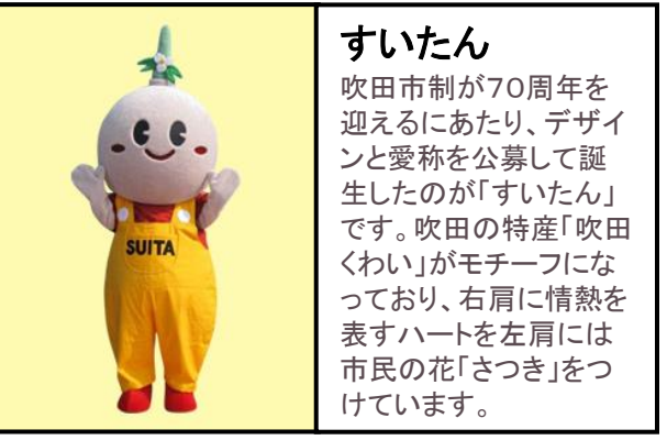
(吹田市より資料提供)

(1) パンフレットの構成を次のように考えました。この案のとおりパンフレットを作るには資料が足りません。どの部分を書くためにどのような資料が必要か、二つさがして下の□に簡潔に書きなさい。