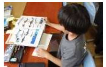
魚の図鑑から情報を選び出し、カードに記入している様子

水族館への校外学習の後に行ったことで、「自分たちで水族館をつくる」という活動に大きく心を動かしている様子であった。生き物を選ぶときには自分が好きな魚や水族館で見た魚、珍しい生き物など、子どもたち一人ひとりが楽しんで選ぶ姿が見られた。子どもたちにとって魅力的な活動を設定できたことで、自然と図鑑の中から情報を得ようとしていた。「図鑑にこんなことも書いてあるんや。」と新たな気づきをしている児童も多く見られた。