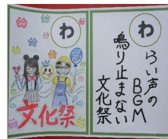
2018文化祭～やお北歌留多～ 図書委員+有志