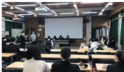
府立枚方高等学校