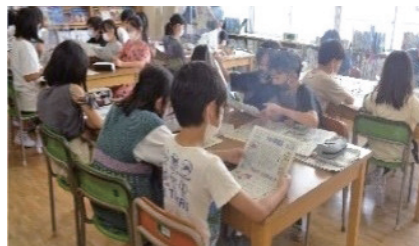
茨木市立葦原小学校