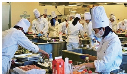
府立咲くやこの花高等学校