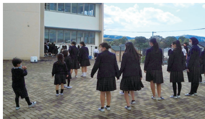
和泉市立南松尾はつが野学園