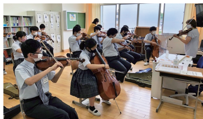
府立むらの高等支援学校