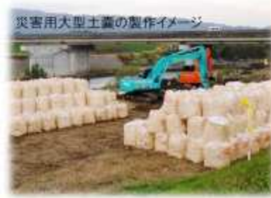
災害用大型土嚢の製作イメージ