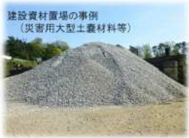
建設資材置場の事例 (災害用大型土嚢材料等)

○維持管理基地では、資材等の備蓄に加え、さらに土嚢の作成や、凍結防止剤の精製等ができる機能を備えたものを想定しています。