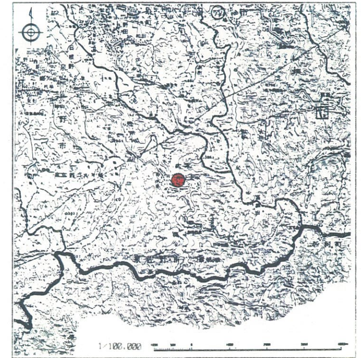
特 記 事 項