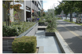
高度処理水を放流している竜華都市拠点地区内水路

このように、身近な水路や河川に高度処理水を放流することで、府民の皆さまに水環境の改善効果を実感していただくとともに、より良い水辺環境を創造しています。