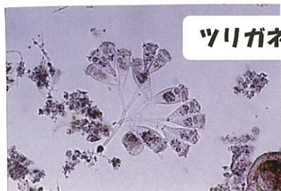
ツリガネムシのなかま