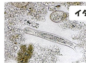
イタチムシのなかま