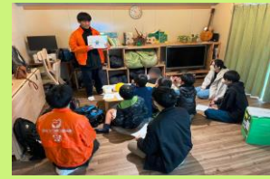
課題を抱える若者向け シェアハウス