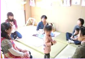
地域子育て支援拠点