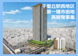
千里丘駅西地区 第一種市街地 再開発事業 市街地再開発事業の仮移転先住戸