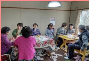
高齢者等の活動交流拠点