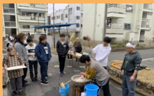
大学の学習・研究拠点 ※門真市営住宅