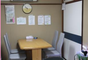
ユースプラザ事業