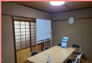
成年後見サポートセンター