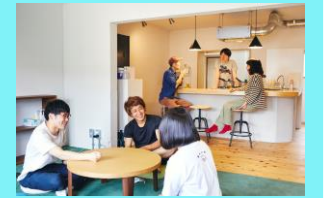
若者の職業的自立モデル事業 (生活支援、就職・自立支援)