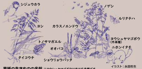
表紙の生きものの名前 ※ヨウシュヤマゴボウ以外は在来種です。イラスト: 永田哲生

お問い合わせ先 大阪府 環境農林水産部 みどり推進室 みどり企画課 都市緑化・自然環境グループ 電話: 06-6210-9557 Fax: 06-6210-9551 住所: 559-8555 大阪市住之江区南港北1丁目14-16 大阪府咲洲庁舎(さきしまコスモタワー) 22階 E-mail: midorikikaku@sbox.pref.osaka.lg.jp URL: http://www.pref.osaka.lg.jp/midori/tayouseipartner/ おおさか生物多様性パートナー