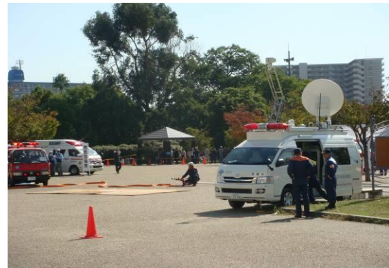
現場映像を送信する大阪府衛星通信車