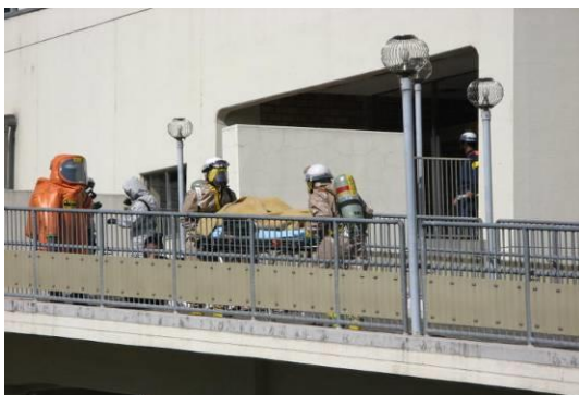
ホットゾーン（危険区域）からの被害者救助