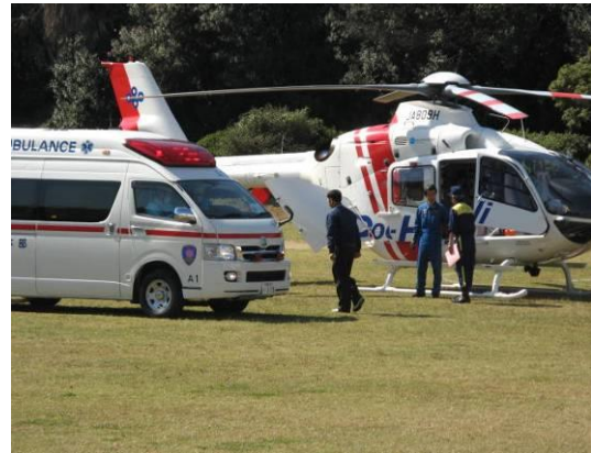
大阪府ドクターヘリによる負傷者搬送