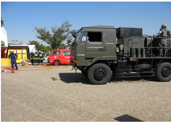
陸上自衛隊による汚染地域の除染