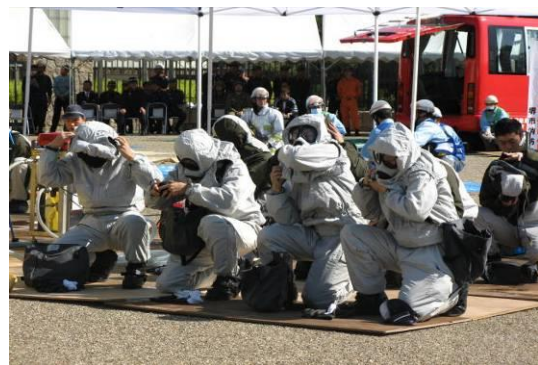
特殊災害に対応する大阪府警 NBC 初動措置隊