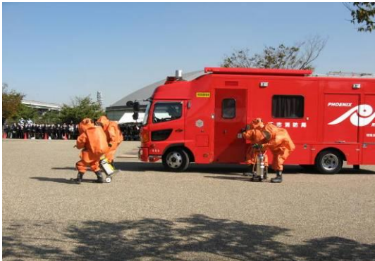
災害現場に駆けつける堺市消防局特殊災害対応隊（通称：ハズマツ隊）