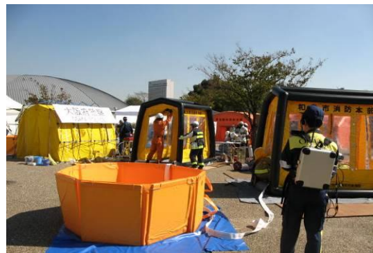
被害者等に付着した汚染物質を洗い流す除染テント/汚水を一時保管する汚水水槽